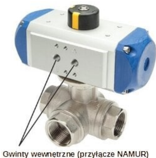
Gwinty wewnętrzne (przyłącze NAMUR)

Zawór kulowy 3-drogowy z napędem pneumatycznym (T2), jednostronnego działania, G1/2, mosiądz (KH3/12T2PE) - Koly Deutschland